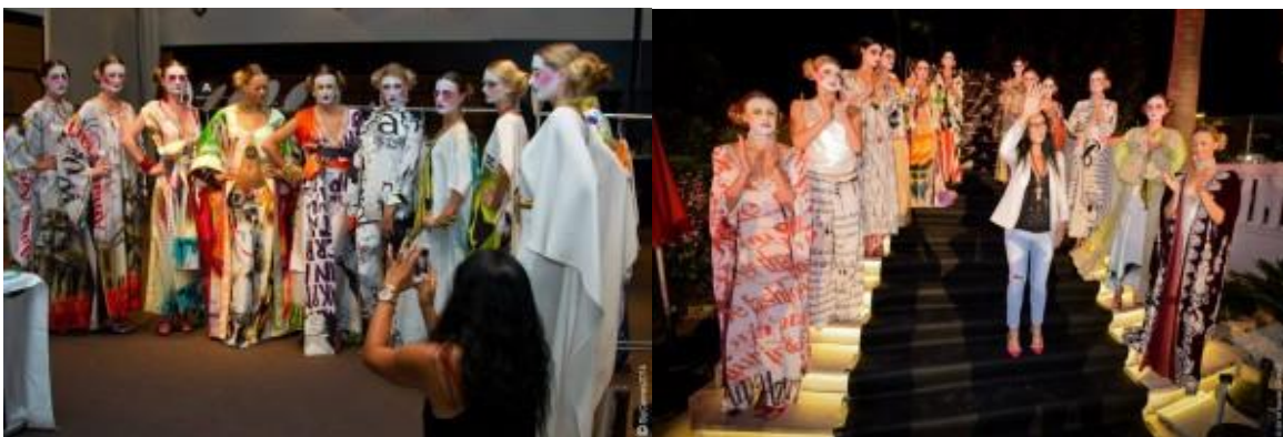
Cette entrée a été publiée dans Event - Fashion Show le 10 août 2014 par natasha .