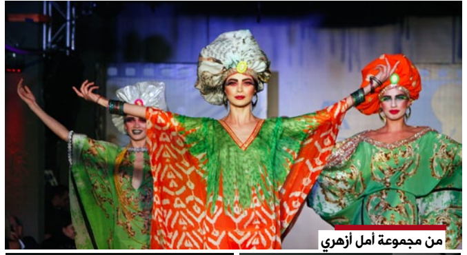
من مجموعة أمل أزھري